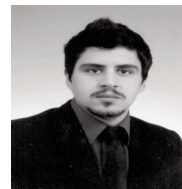
ΣΥΝΕΧΕΙΑ ΣΕ ΣΕΛ. 2