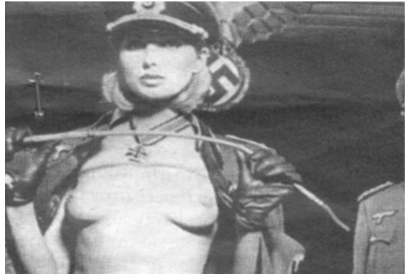
Της μόδας τα ναζιστικά όργια και οι ναζιστικές σφαλιάρες...