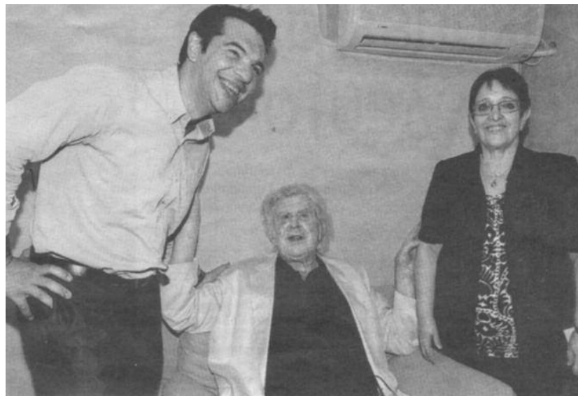
Αριστερός μπαμπάς και αριστερά παιδιά. Να μας ζήσουν!