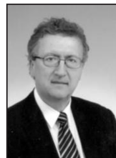
του Γιώργου Μάλλιου

Από εδώ και πέρα ,μόνο με εγγυητική επιστολή η πληρωμή χρηματικών απαιτήσεων σε βάρος του Δημοσίου έχουμε τα παρακάτω σύμφωνα με σχετική εγκύκλιο του υπουργείου Οικονομικών και στην οποία διευκρινίζονται τα εξής: • Προκειμένου να εκτελεστεί δικαστική απόφαση από την οποία απορρέει χρηματικά υποχρέωση του Δημοσίου, στην περίπτωση που αυτή δεν έχει καταστεί αμετάκλητη, ο δικαιούχος πρέπει να προσκομίσει εγγυητική επιστολή τράπεζας ισόποση με την απαίτησή του κατά του Δημοσίου. Το ίδιο ισχύει και όταν η χρηματική υποχρέωση του Δημοσίου απορρέει από άλλο, πλην της δικαστικής απόφασης, εκτελεστό τίτλο (ως τέτοιος τίτλος νοείται κυρίως η διαταγή πληρωμής), ο οποίος έχει προσβληθεί με ένδικο βοήθημα. • Το ύψος της εγγυητικής επιστολής μπορεί, κατόπιν αιτήσεως του δικαιούχου, να μειώνεται μέχρι το ήμισυ, με απόφαση ή του δικαστηρίου που εξέδωσε την απόφαση ή του δικαστηρίου στο οποίο εκκρεμεί η εκδίκαση του ένδικου βοηθήματος. • ΟΙ Δ ΟΥ, όταν πρόκειται να εξοφλήσουν χρηματική απαίτηση σε βάρος του Δημοσίου, η οποία απορρέει από δικαστική απόφαση ή διαταγή πληρωμής, απαιτείται να ελέγχουν παρεμπιπτόντως τη συνδρομή των προϋποθέσεων των διατάξεων της παρ. 5 του άρθρου 326 του ν. 4072/2012 και σε αρνητική